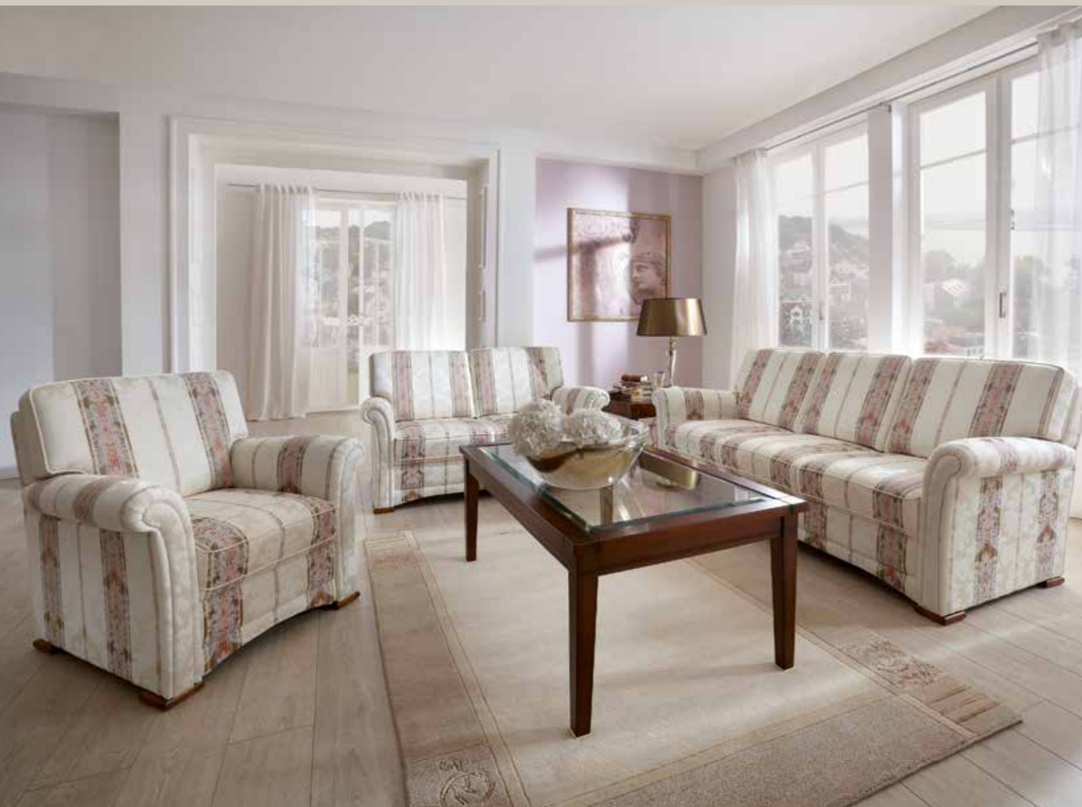
Sofa in den Breiten 144, 174, 199 cm erhältlich