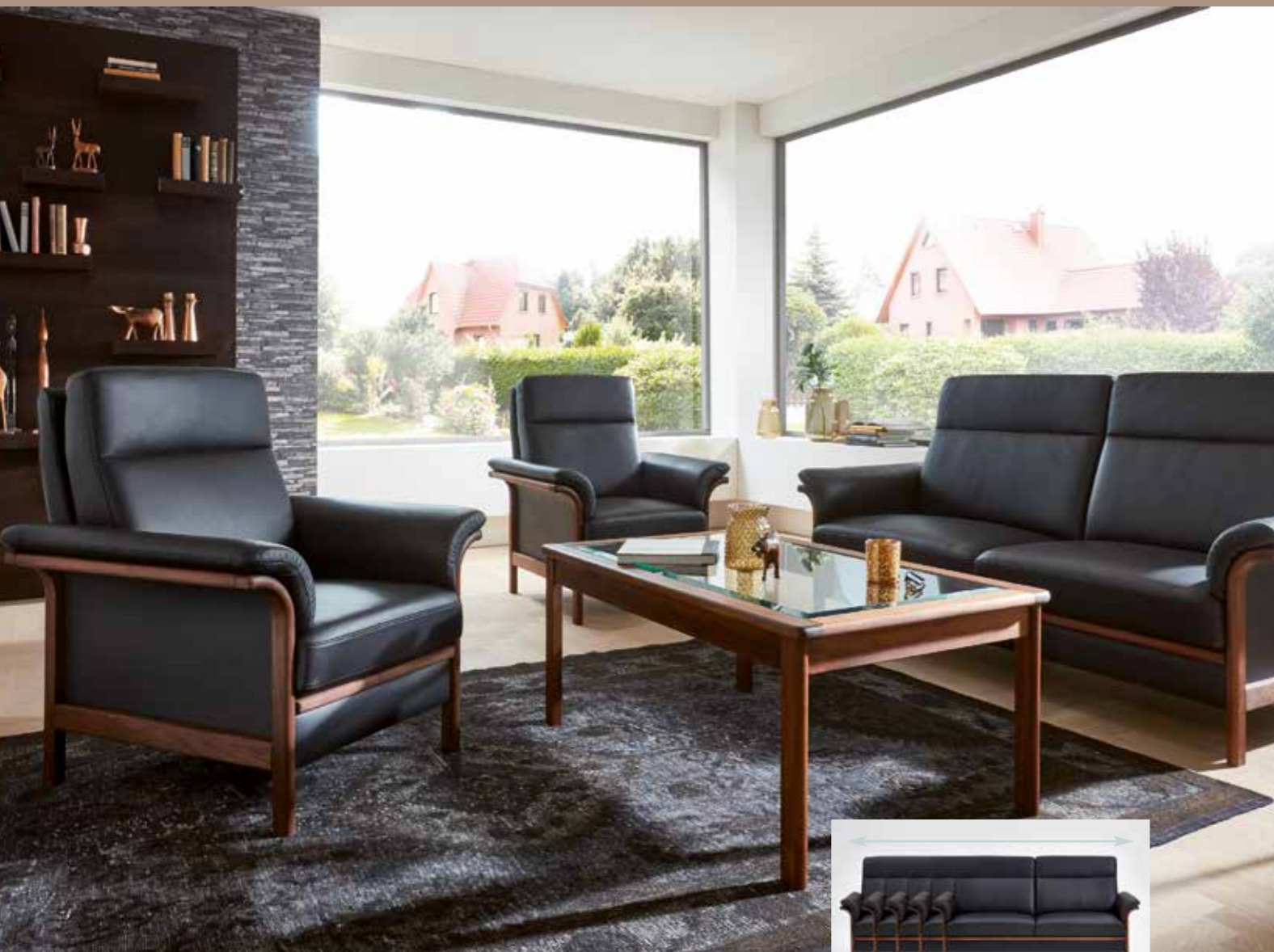
Sofa in den Breiten 140, 164, 178, 195, 215 cm erhältlich