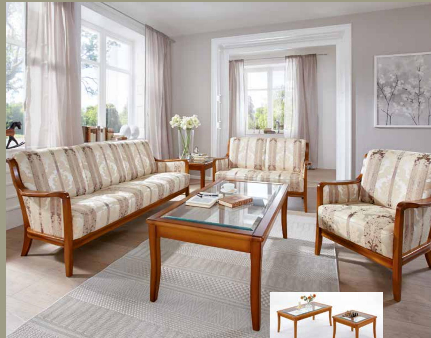
Passender Couchtisch oder Beistelltisch in 5 Größen lieferbar