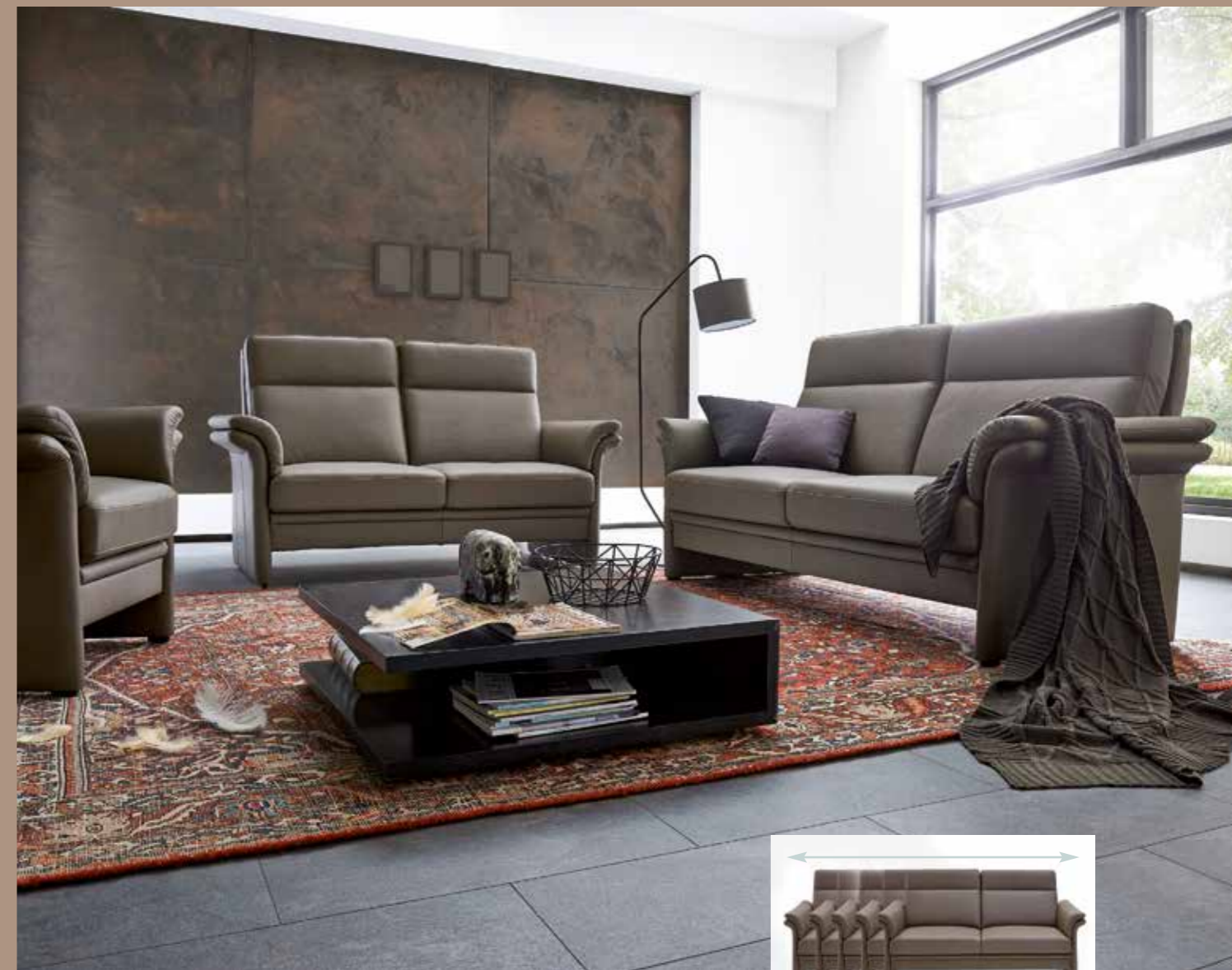
Sofa in den Breiten 140, 164, 178, 195, 214 cm erhältlich

Sitzpolsterung Federkern oder Kaltschaum preisgleich. Weitere Massivholz-Ausführungen: Kirschbaum, Eiche, Buche.