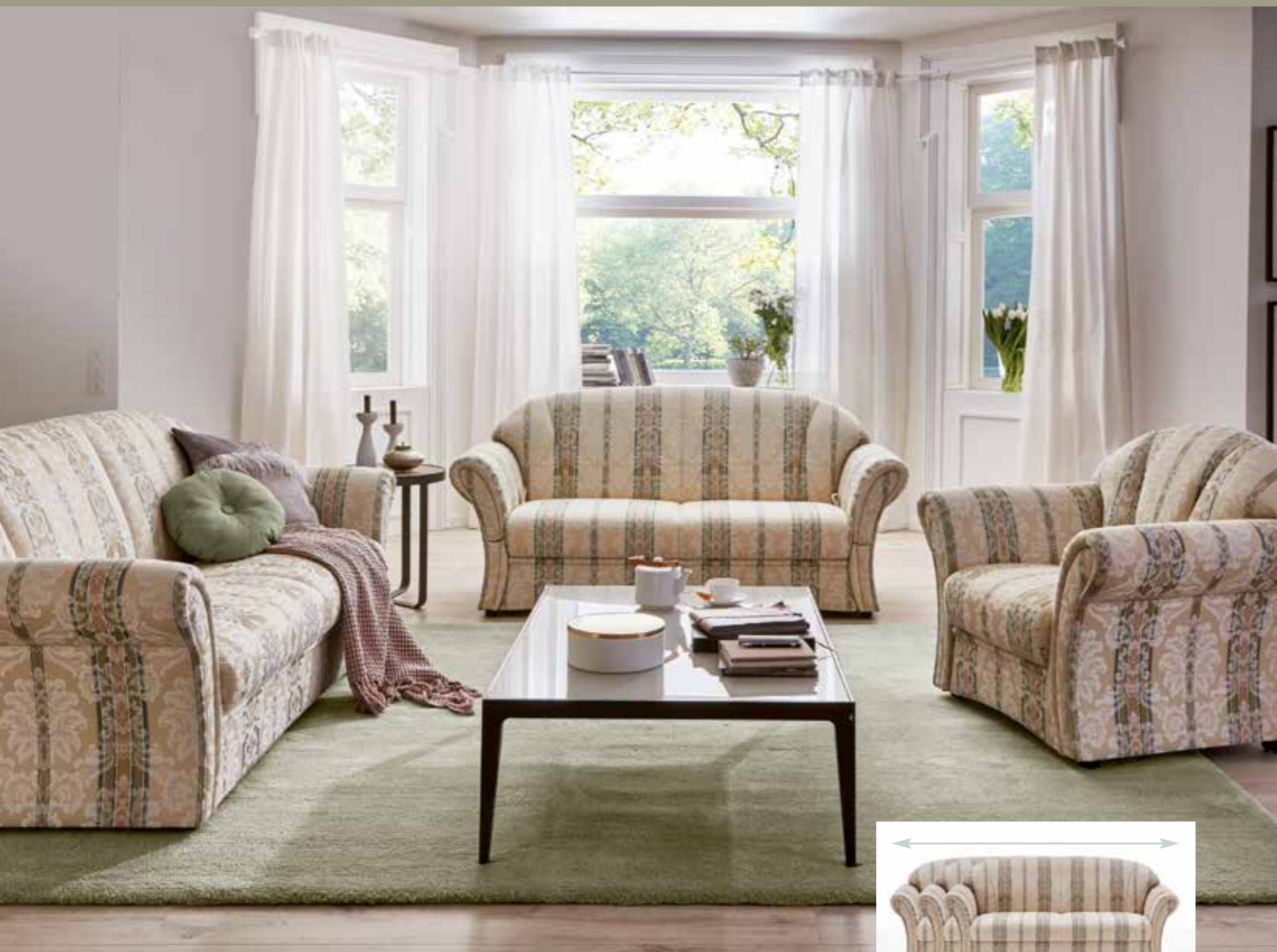
Sofa in den Breiten 159, 183, 197 cm erhältlich