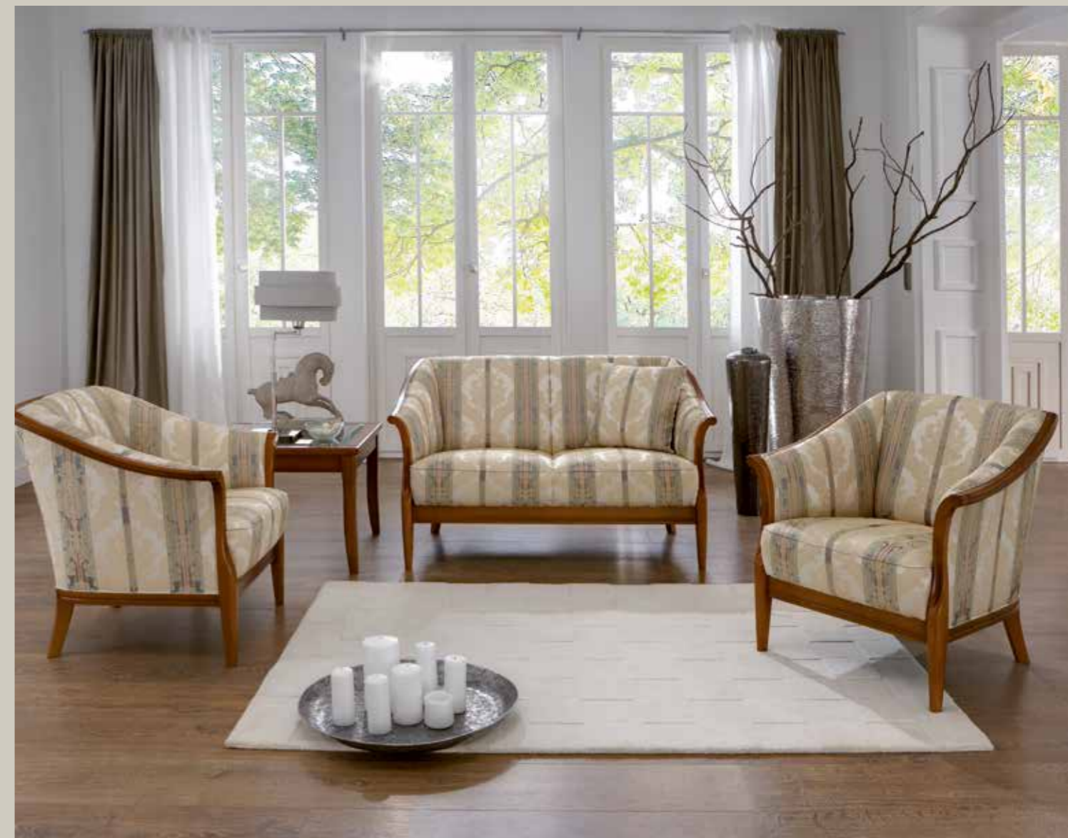
Sofa in den Breiten 133 und 189 cm erhältlich

Höhe 87 cm, Tiefe 87 cm. Sitzhöhe 44 cm oder 46 cm preisgleich, Sitztiefe 51 cm oder 53 cm preisgleich.